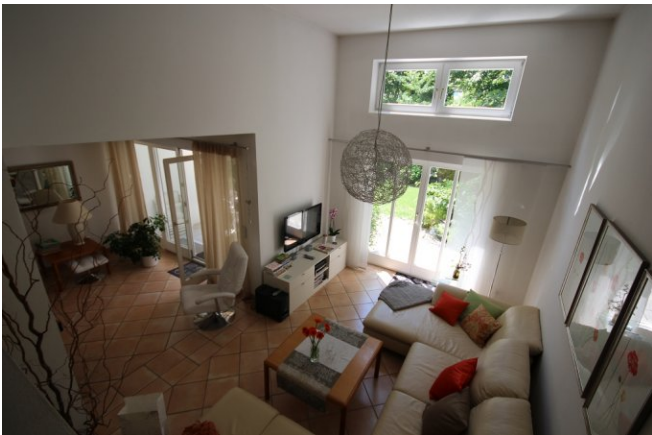
ein Blick in den Wohnbereich