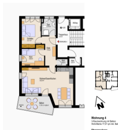
Wohnung 4 147,00 m 2 (inkl. Balkon) 147,00 m 2 (inkl. Balkon) Obergeschoss