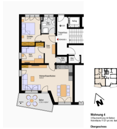
Wohnung 4 147,00 m 2 (inkl. Balkon) 147,00 m 2 (inkl. Balkon) Obergeschoss